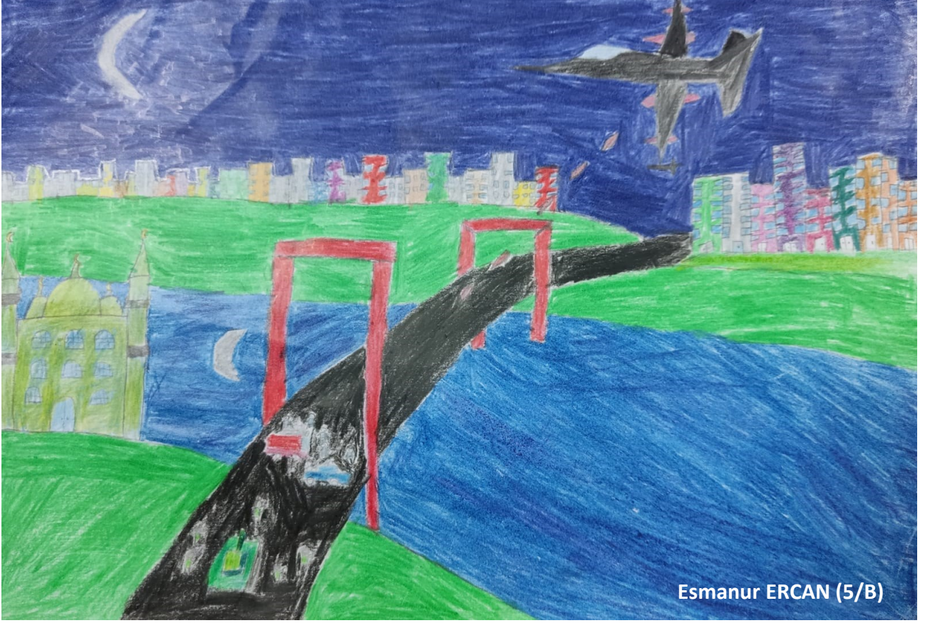
Esmanur ERCAN (5/B)